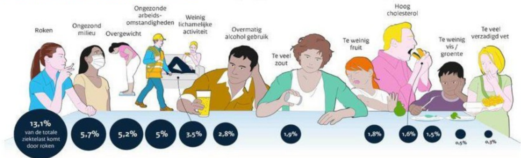
Figuur 3-1 Verorzakers van ziektelast in Nederland 9